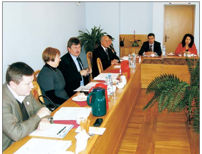
Goście w sali sesyjnej naszego Urzędu