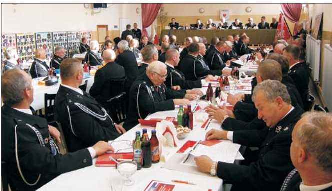
Obrady w sali remizy OSP w Zamarskach