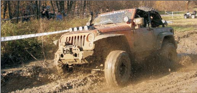
Najbardziej błotnisty odcinek trasy •