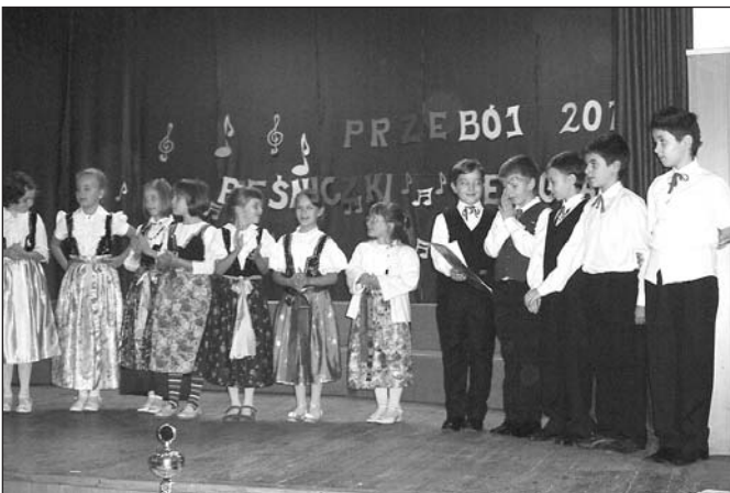
Na scenie Zespół Regionalny Szkoły Podstawowej w Kończycach Wielkich • Fot. Józef Stoszek

26 listopada w sali widowiskowej GOK w Hażlachu odbył się czwarty z kolei konkurs na „Przebój pieśniczki regionalnej 2011”. Jego celem jest ochrona od zapomnienia wspaniałego dziedzictwa - przepięknych, melodyjnych i bogatych w treść naszych cieszyńskich „pieśniczek”. Do rywalizacji zgłosiło się pięć zespołów śpiewających z gminy Hażlach, których na wstępie dyrektor GOK gorąco przywitał, dziękując za przygotowanie repertuaru. Konkurs prowadził Jan Chmiel, znany poeta ludowy, muzyk, gawędziarz, popularyzator cieszyńskiej gwary.