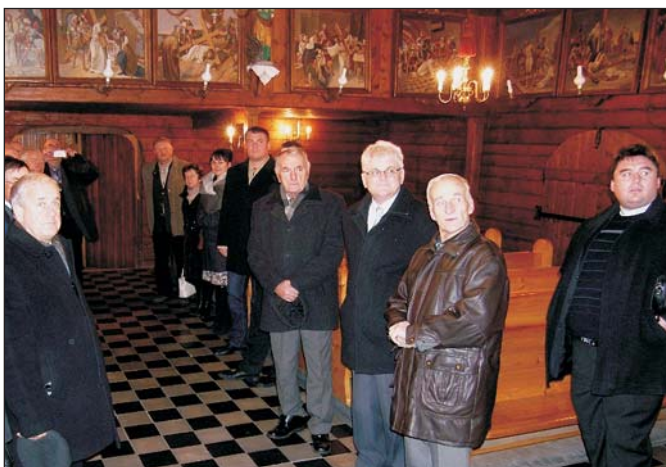
Zwiedzanie zabytkowego kościoła w Zamarskach

9 sierpnia bieżącego roku w Dětmarovicach w Republice Czeskiej przebywali przedstawiciele władz naszej gminy oraz organizacji społecznych, klubów sportowych i parafii katolickiej w Pogwizdowie. Podpisano wówczas „List Intencyjny o Współpracy”. 24 listopada przybyli do naszej gminy z rewizytą goście z Czech.