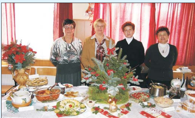
KGW Kończyce Wielkie