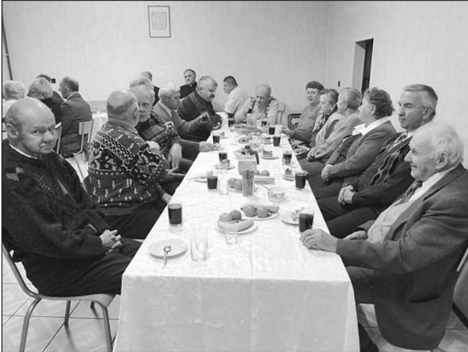
Spotkanie seniorów w Rudniku •