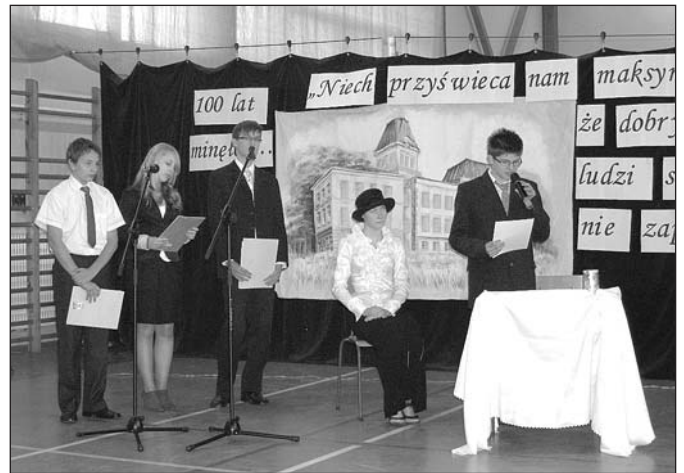
Występ uczniów szkoły

Ten wielki jubileusz rozpoczęliśmy od mszy świętej w pobliskim kościele. Następnie delegacja uczniów wraz z nauczycielami i poczetem sztandarowym na czele udała się na grób patronki, aby złożyć na nim kwiaty i w ten sposób jeszcze raz uczcić tę wielką działaczkę społeczną, za to wszystko, co uczyniła dla kończyckiej społeczności. Wśród jej licznych zasług należy choćby wymienić powstanie budynku dawnej szkoły podstawowej, w którym obecnie ma swoją siedzibę gimnazjum.