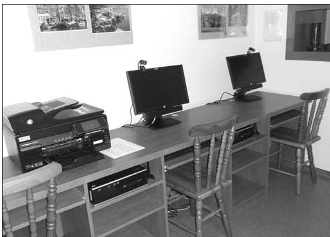
Wyposażenie otrzymane w ramach programu

oferowanych mieszkańcom naszej gminy. W tym względzie niezbędne było zawiązanie partnerstwa z innymi bibliotekami. Gminna Biblioteka Publiczna w Hażlachu jako biblioteka wiodąca nawiązała współpracę z bibliotekami partnerskimi z Ustronia, Dębowa oraz Poraja i jako jedyna ze Śląska Cieszyńskiego przystąpiła do ogólnopolskiego programu. Aby wziąć udział w programie, biblioteki musiały uzyskać zgodę władz gmin i elektronicznie złożyć wnioski, które były oceniane przez komisję konkursową. Zakwalifikowały się te placówki, które zdobyły najwięcej punktów. Komisja przyznawała je za nawiązanie współpracy z innymi bibliotekami, a także za opis działań, którymi biblioteka chciałaby się pochwalić. O przyjęcie starało się 1711 bibliotek znajdujących się na wsiami i w małych miastach. Najwięcej zakwalifikowało się na Lubelszczyźnie, w Małopolsce i na Dolnym Śląsku. Łącznie w całej Polsce będzie ich więc ponad 3300.