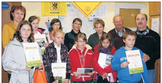
W siedzibie cieszyńskiego oddziału PTTK

Po raz drugi Komisja Ochrony Przyrody Oddziału „Beskid Śląski” Polskiego Towarzystwa Turystyczno-Krajoznawczego w Cieszynie przeprowadziła konkurs plastyczny „Poznajemy pomniki przyrody w gminie Hażlach”. Podsumowanie jego wyników i rozdanie upominków książkowych, ufundowanych między innymi ze środków Gminy Hażlach, nastąpiło 15 listopada w siedzibie cieszyńskiego oddziału PTTK.