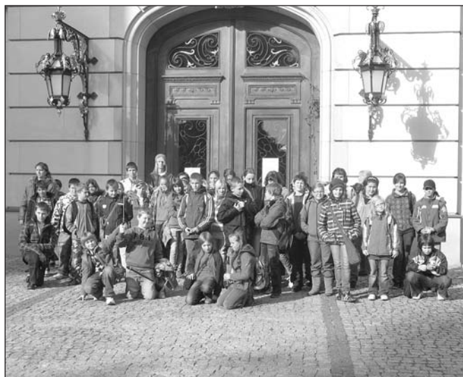
Podczas wizyty w Pszczynie

Szkoła Podstawowa w Kończykach Wielkich bierze udział w programie „Partnerskie Projekty Szkół Comeniusa”, którego celem jest współpraca ze szkołami z zagranicy. Nasza szkoła drugi rok uczestniczy w projekcie, który nosi tytuł „Europejska podróż”, a szkołami partnerskimi są placówki z Czech i Słowacji. W ramach tego przedsięwzięcia w szkole zorganizowano już wiele imprez, przedstawień, konkursów, a także wizyt w zaprzyjaźnionych szkołach.